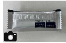
添付イメージ （製造番号、使用期限）