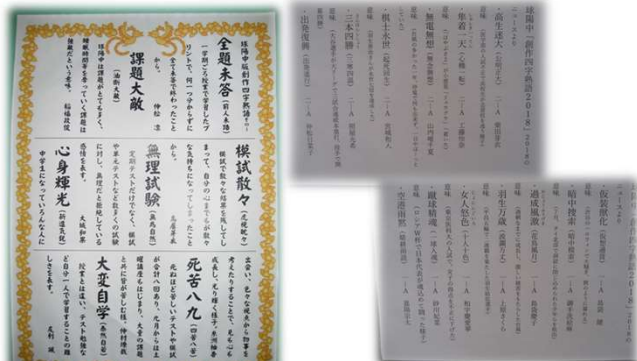
校舎の階段に掲示されている傑作四字熟語。高校生も足を止めて中学生の感性に思わず笑みがこぼれています